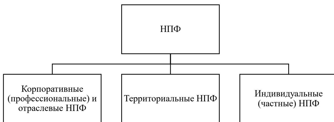
Рис. 2. Виды негосударственных пенсионных фондов*

Всю совокупность негосударственных пенсионных фондов можно классифицировать, и на данный момент можно выделить несколько видов НПФ, которые функционируют в Российской Федерации (рис. 2).