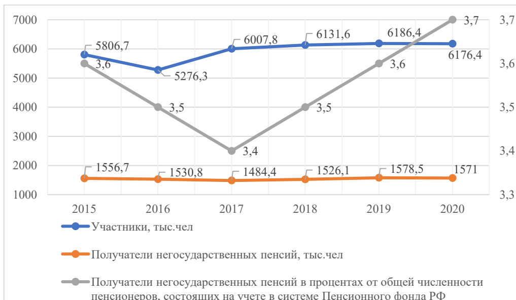
Рис. 2 Динамика отдельных показателей системы НПО за период 2015–2020 гг.*

*Составлено авторами на основе источника [7]